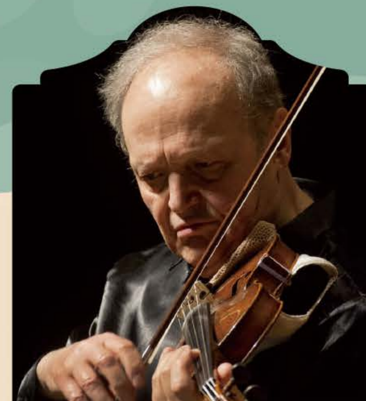
費瑟林·帕拉希克弗夫 ▲

兩位小提琴首席與夏綠弦樂團交織在一起會碰出甚麼火花呢？ 歡迎在4月2日的晚上前往東華大學超新的藝術學院音樂廳，一同來欣賞！